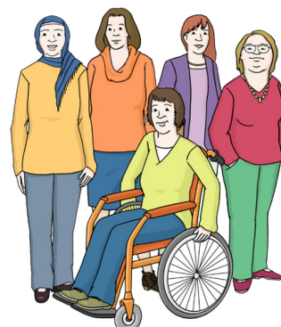
Abbildung 2 Illustration Frauengruppe