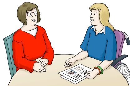
Abbildung 4 Illustration, Beratung

Aber man muss vorher einen Termin vereinbaren.